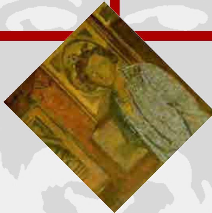
Walter Richard Sickert, La Dame en bleu (détail), 1933, huile sur toile, Attingham Park, The National Trust.