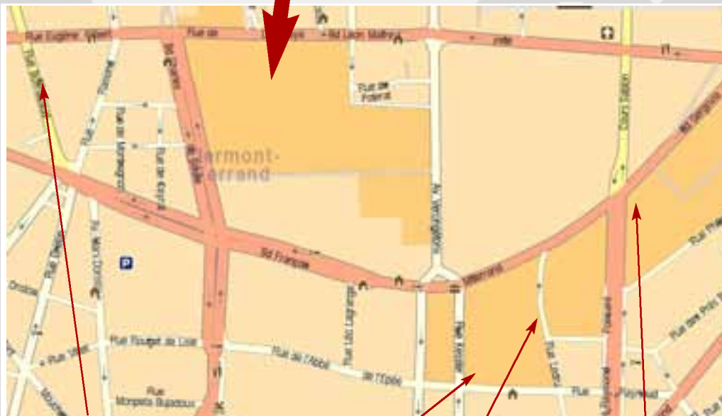
Hôtel Kyriad Centre 51, rue Bonnabaud 04.73.93.59.69