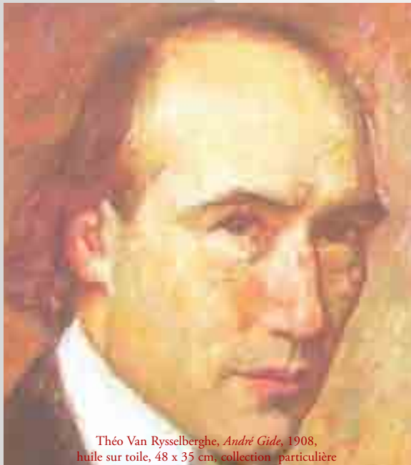
Théo Van Rysselberghe, André Gide , 1908, huile sur toile, 48 x 35 cm, collection particulière

Anne-Sophie Angelo, Le Roman des Faux-monnayeurs : des personnages en mode fugué